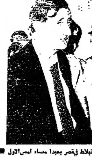
لقاء الرئيس سلام والسيد كمال جنابلاط في قصر بعبدا مساء امس الاول

شائلا يوجه رسالة الى أعضاء «التنظيم الناصري» وجه السيد كمال شائلا الامن العام لتنظيم الناصري اتحاد قوى الشعب العامل رسالة الى اعضاء التنظيم ، قاسية استهزاء الحزبي الاصيل احمد بيبيل في معركة منيا الشعب ، اعلن فيها ان استشهاده في اقدس ساحات المواقب يجمعنا جميعا تقفا في لحظة خشوع ايام جنائنه الطاهر . وقال : هناك في ارض الجيوب، المرقعة على نلال فلسطين ، نكف الشهاده من اجل عروبة لبنان واستعادة الوطن المحتل .